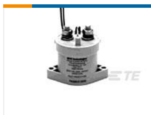
TE 产品编号 1-1618002-8 EV200HAANA=RELAY, SPST-NO WITH