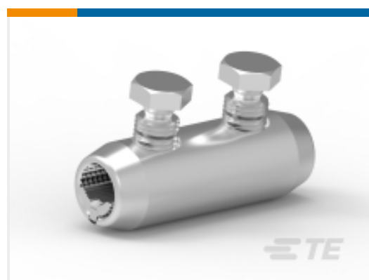
TE 产品编号 A84872N001 BSMU-35/150