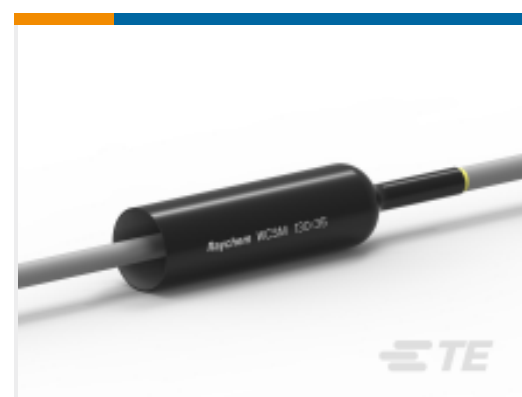
TE 产品编号 CU4621-000 WCSM-130/35-1000/S(S5)