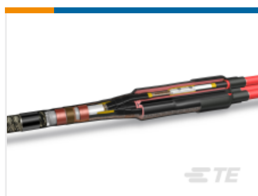
TE 产品编号 D57525-011 MXSU-12A/1XU-3SB