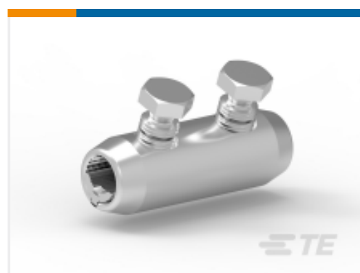
TE 产品编号 E05256N001 BSMB-35/150