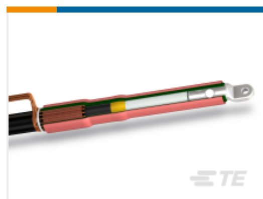
TE 产品编号 CF6351-005 IXSU-F3131-ML-4-13