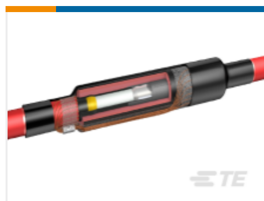
TE 产品编号 C44894-005 MXSU-5121