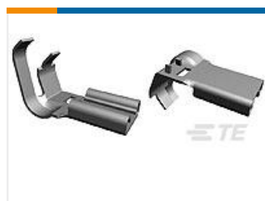
TE 产品编号 180430-2 250 FASTON, FLAG, REC., 20-16 AWG, TPBR