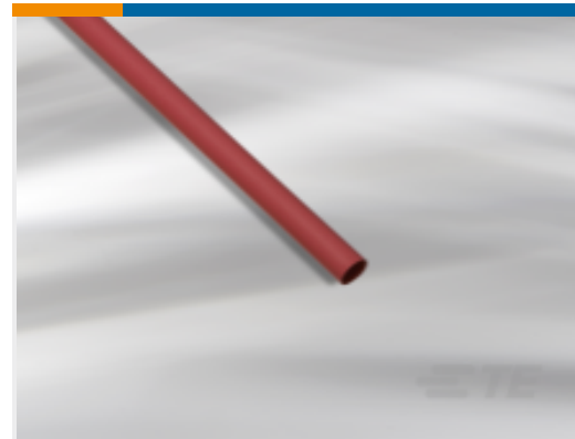
TE 产品编号NB07266001 BATTU-25.4/12.7-A1-2-102MM