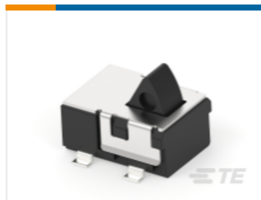
TE 产品编号2331395-1 DET SW4.7X3.5X2.25 GW VERT. NOH AG RL