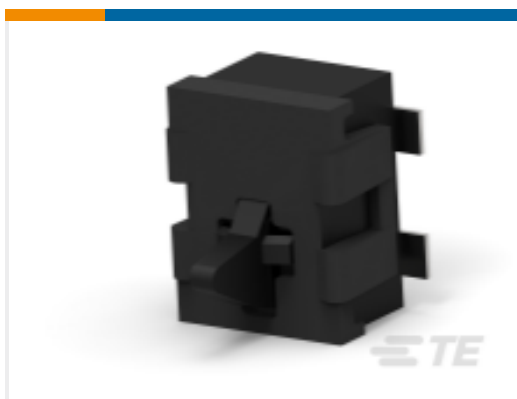
TE 产品编号2331379-1 DET SW3.5X2.98X1.95 GW VERT. NO AG RL