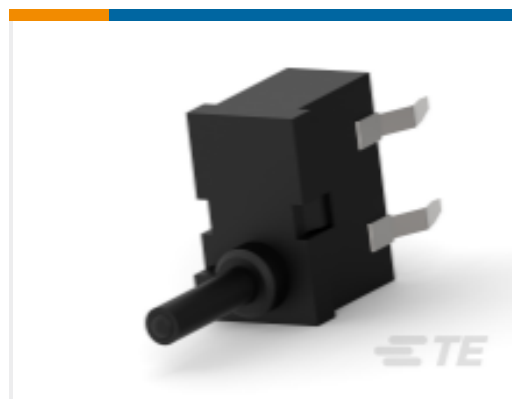
TE 产品编号2331396-1 DET SW6.5X3.9X6.0 TH VERT. NO AG TB