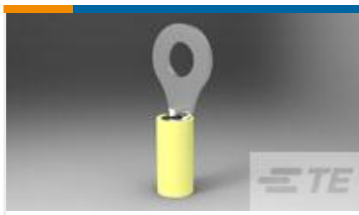
TE 产品编号320569 TERMINAL,PIDG R 12-10 1/4