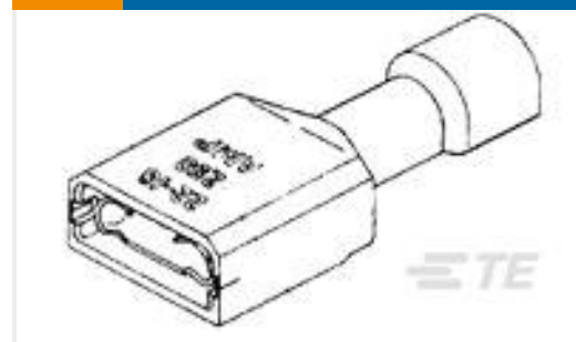
TE 产品编号2-520274-2 ULTRA-FAST 187 ASY REC 22-18 TPPB