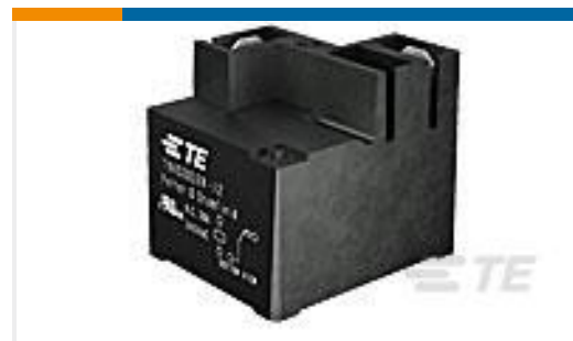
TE 产品编号1-1419104-7 T9AS1D22-12