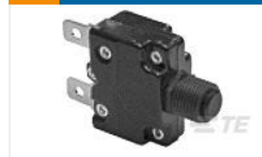
TE 产品编号1423675-3 W57-XB7A4A10-5=CKTBKR,THERM,PB