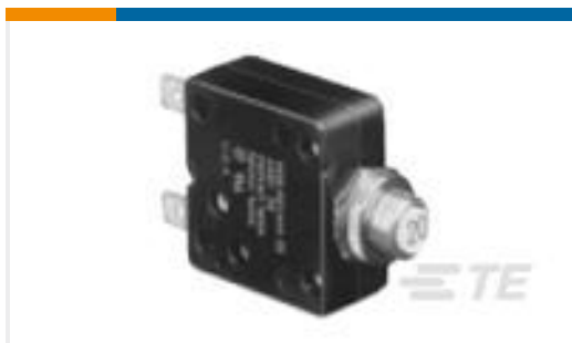
TE 产品编号1-1393249-2 W58-XB1A4A-20=W58