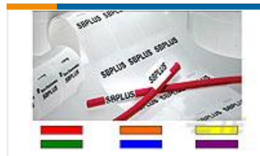
TE 产品编号CM9614-000 SBP100143WE5