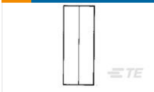
TE 产品编号34137 SPLICE,SOLIS PARA BRZD 16-14