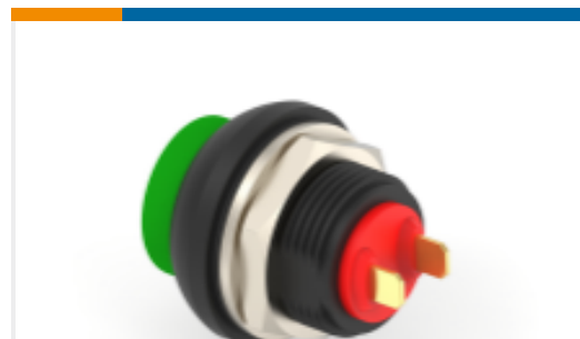
TE 产品编号2329328-4 PB OFF/ON HC GRE M1 TERM. IP68