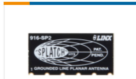
TE 产品编号ANT-916-SP Antenna SP PCB RPC 916MHz SMT