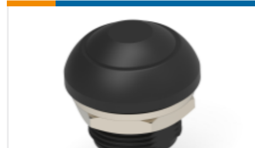
TE 产品编号2329383-1 PB OFF/ON FC BLK M1 TERM. IP68