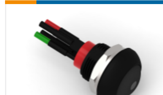
TE 产品编号2329389-4 PB OFF/ON FC BLK M1 TERM GRE LED IP68 50