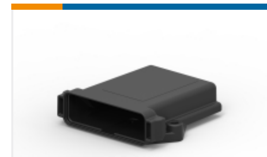
TE 产品编号EEC-325X4A ENCLOSURE, 3.25 X 4, BLK, VENT