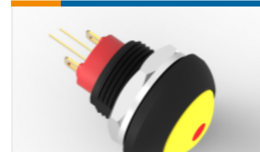
TE 产品编号1-2329387-2 PB OFF/ON FC YLW M1 TERM RED LED IP68