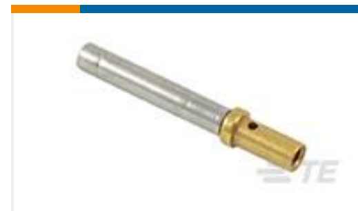
TE 产品编号0462-201-2031 SOC, SOLID, SIZE 20, 20AWG, AU