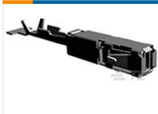
TE 产品编号1418884-3 AMP MCP 1.5K, CONTACT, SWS