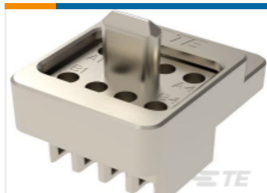
TE 产品编号2828434-1 NanoRF BP MODULE 8 POSITION SS