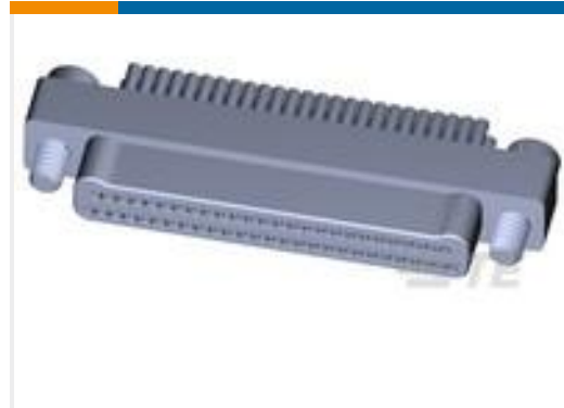
TE 产品编号1925220-9 TMN2N051PC2DM018S = M32139/03-G05SNS