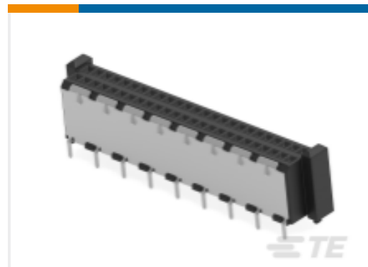
TE 产品编号354177-E MSPEED 50 F SMDTHR F6 B AB VV 137 094 *