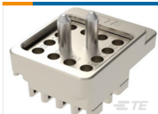
TE 产品编号2313228-1 NanoRF BACKPLANE MODULE, 12 PSN, SS