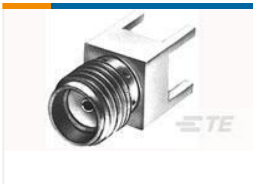
TE 产品编号1056555-1 SCD,2062 5050 24,SMA