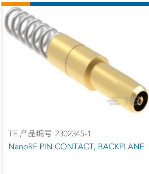
TE 产品编号 2302345-1 NanoRF PIN CONTACT, BACKPLANE