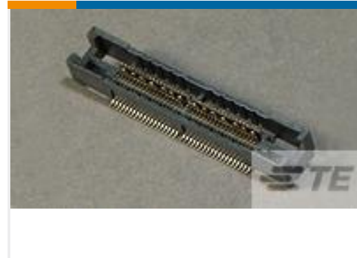
TE 产品编号2-5767004-3 MICTOR RECEPT ASSY, 76 POS.