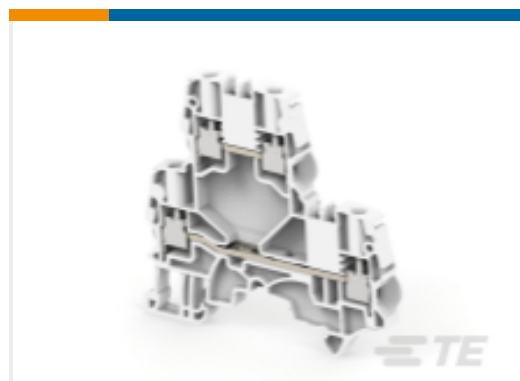
TE 产品编号1SNK505210R0000 ZS4-D2