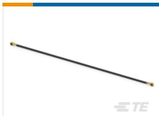
TE 产品编号1-2016698-6 RF CA,UMCC GEN4-GEN4,1.13MM CABLE,L200MM