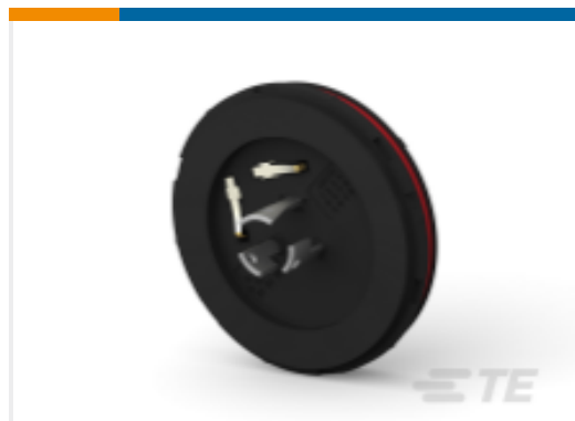
TE 产品编号2213730-1 Photo Control Base