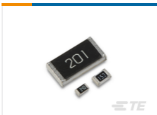
TE 产品编号2176330-1 CRGP 2010 10R 1%