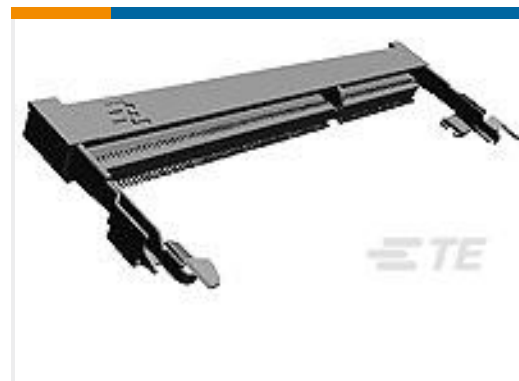
TE 产品编号2-2013289-1 EMBOSS TAPE DDR3 204P 5.2H STD