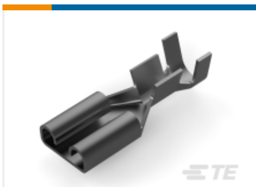
TE 产品编号5-160447-5 FF 250 REC 1.0-2.5MM2 PRBR LP