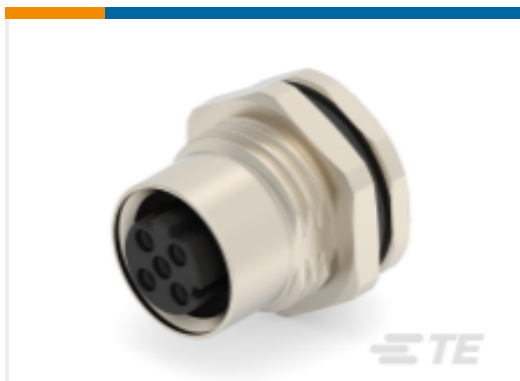
TE 产品编号T4131512041-000 M12,REAR MOUNT,FEMALE,D,4P, SOLDER WIRE