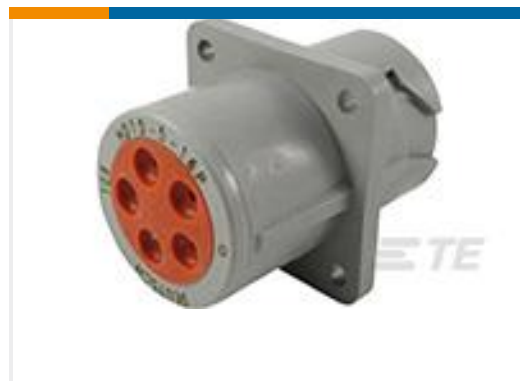
TE 产品编号HD10-5-16P SQ FG REC ASM