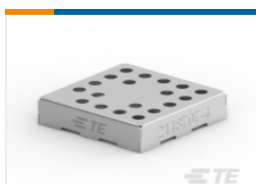
TE 产品编号2118707-4 1 PC STD SHIELD, AL-16.50X16.50X3. 60MM