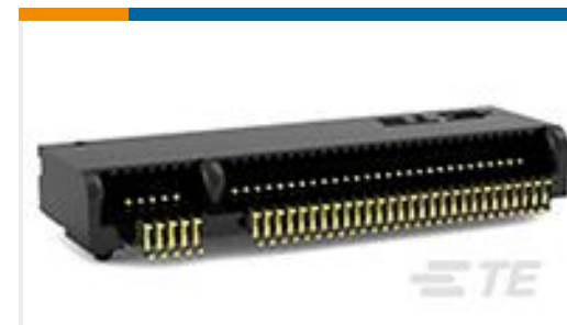
TE 产品编号2199119-4 M.2 0.5PITCH 3.2H KEY E 15U" AU