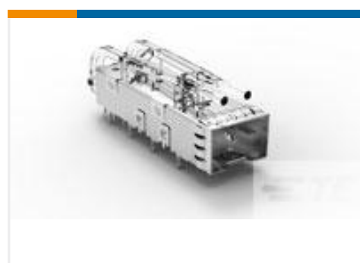
TE 产品编号2007254-1 SFP+ 1x1 Cage Assembly, Light Pipe