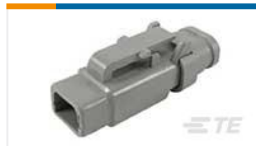
TE 产品编号DTM06-2S-E007 PLG, 2P, GRY, N, XCAP