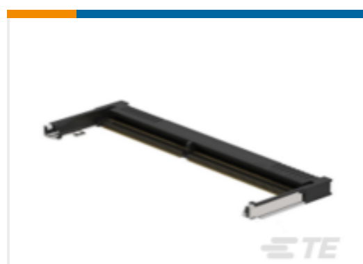
TE 产品编号2309407-1 DDR4 SO DIMM Sockets