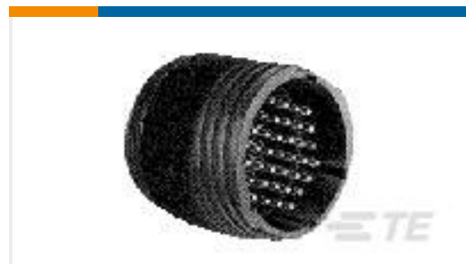
TE 产品编号206036-5 CPC RECPT ASSEMBLY SIZE 17-16