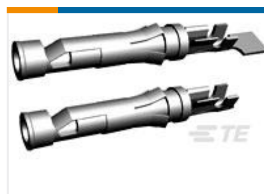
TE 产品编号1-66358-3 III+ SKT, 18-14, 30AU/FL, STRIP