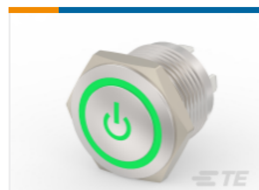
TE 产品编号2213775-7 AV16 SPM 0.4VA POWER LED GREEN 12V