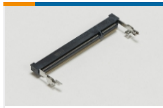
SO DIMM 插槽(39)