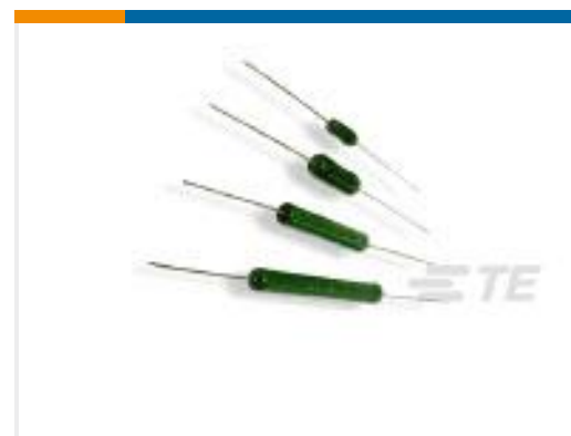
TE 产品编号2-1623773-1 C10 33K 5% (LOOSE)