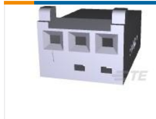
TE 产品编号1375820-3 CST-100 II HOUSING 3 POS