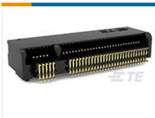
TE 产品编号2199230-4 M.2 0.5PITCH 4.2H KEY E 15U" AU