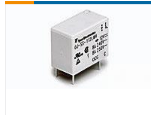
TE 产品编号1461492-5 OJT-SS-112LM,000 RELAY