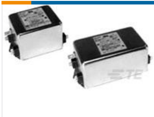
TE 产品编号6609052-2 10VN1=F7416 S0