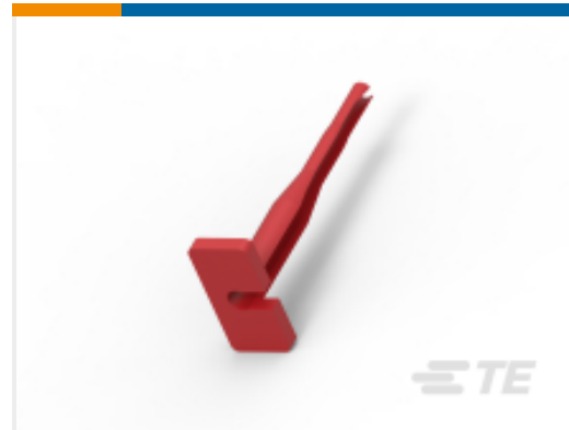
TE 产品编号776106-1 EXTRACTION TOOL