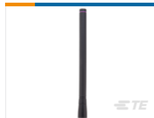
TE 产品编号L9000021-01 Antenna 1/2 Wave Whip 2.4GHz SMA