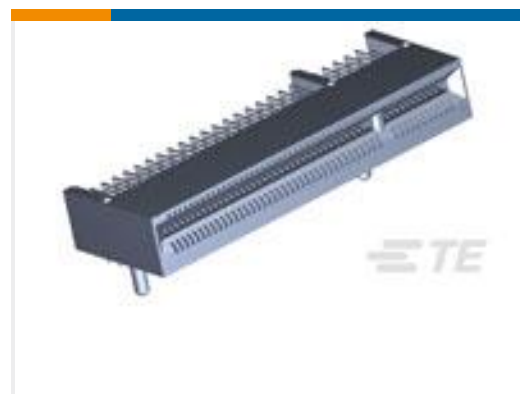
TE 产品编号2-1761465-1 PCI Express RA assy 5.8mm slot 2.3 mm pc