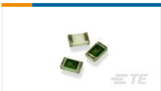
TE 产品编号1-1879215-0 CPF 0402 4K99 0.1% 25PPM 1K RL