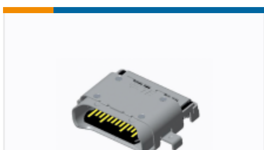
TE 产品编号1-2295018-2 USB TYPE C, REC OFFSET 0.65MM DUAL SMT