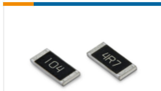
TE 产品编号2-1879207-1 RN 0603 324K 0.1% 10PPM 5K RL