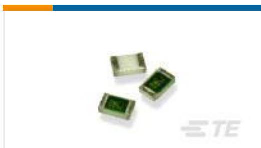
TE 产品编号9-1879214-2 CPF 0402 3K32 0.1% 25PPM 1K RL