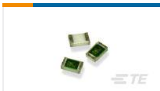
TE 产品编号1-1879208-3 CPF 0402 33R 0.1% 25PPM 1K RL