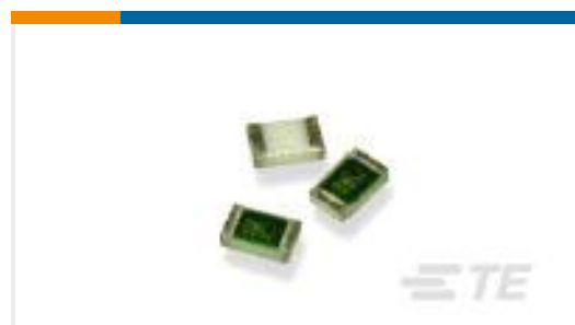
TE 产品编号4-1879214-8 CPF 0402 1K05 0.1% 25PPM 1K RL