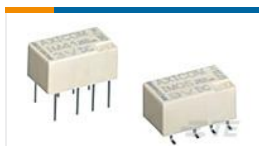
TE 产品编号9-1462037-9 IM06CGR=IM RELAY 140mW12V HDV