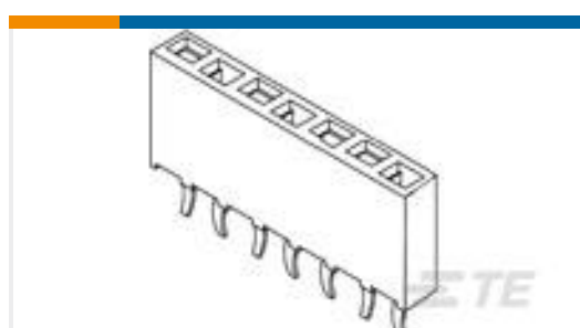
TE 产品编号215297-5 5P HV100 REC CON. TE, 7.0MM