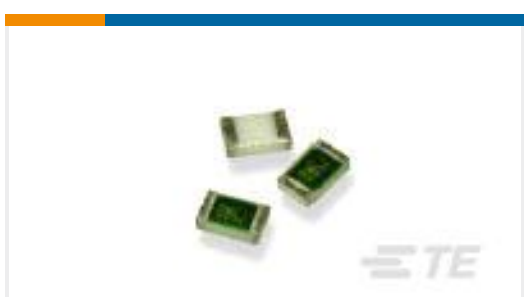
TE 产品编号4-1879208-9 CPF 0402 1K0 0.1% 25PPM 1K RL