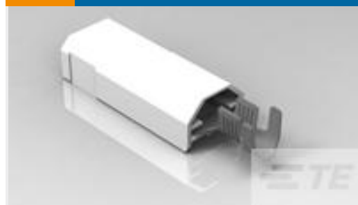
TE 产品编号521227-2 ULTRA-POD 250 ASSY TAB 12-10 AWG TPBR