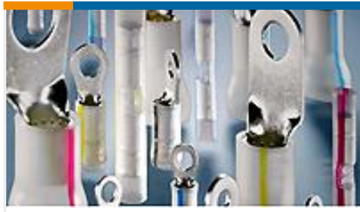
TE 产品编号53423-1 TERMINAL,PIDG PVF2 R 12-10 6