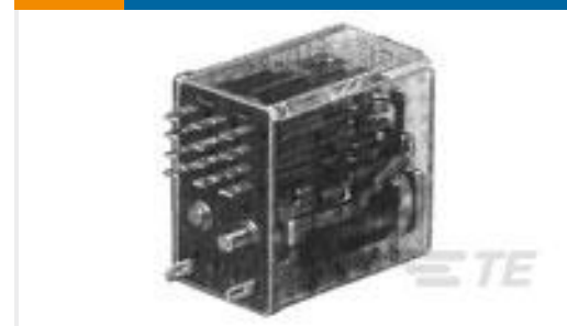
TE 产品编号1393766-3 R10-E1X2-S800=R10