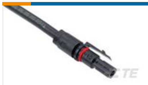
TE 产品编号1987559-1 PHOTOVOLTAIK CONNECTOR, 2.5 sqmm