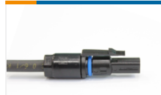
TE 产品编号1-1987559-2 PHOTOVOLTAIK CONNECTOR, 4sqmm