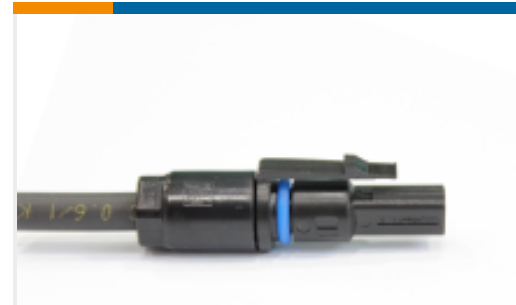
TE 产品编号1-1987559-1 PHOTOVOLTAIK CONNECTOR, 4sqmm