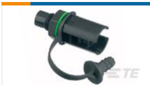
TE 产品编号1394739-1 STECKVERB.ABDECKUNG