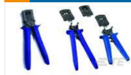
TE 产品编号1-1579004-2 CSV10 CRIMPING HANDTOOL SOLARLOK 4-6