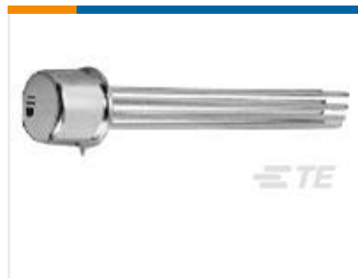
TE 产品编号2-1617119-5 J1MSC-12XM = M39016/10-035M