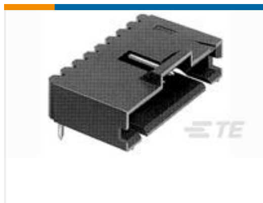
TE 产品编号6-103634-2 13 MTE HDR SRRA LTCH.100CL LF