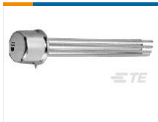
TE 产品编号4-1617118-3 J1MAP-5XM = M39016/7-014M