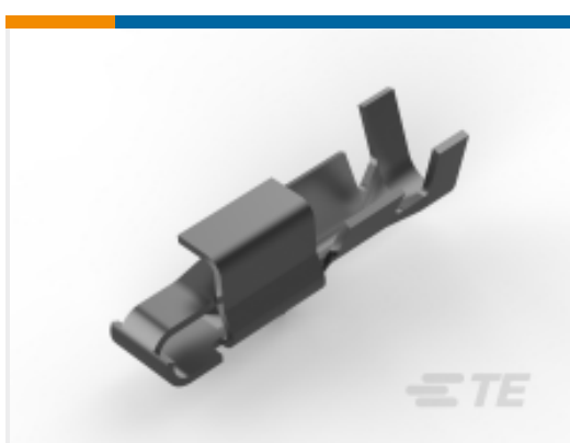
TE 产品编号 CAT-103156-WTBCC Connector Contacts: Wire-to-Board Socket, SL 156