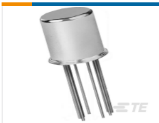
TE 产品编号1617542-7 JMACDD-12XL=M39016/20-052L