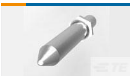
TE 产品编号223982-1 Stainless Steel Guide Pin M4x0.7