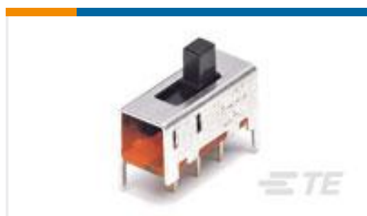
TE 产品编号1825257-1 MSS120004=SPDT SL SW VERT AG