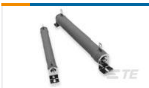
TE 产品编号1879456-6 TE 2000W 2R7 5% Bracket