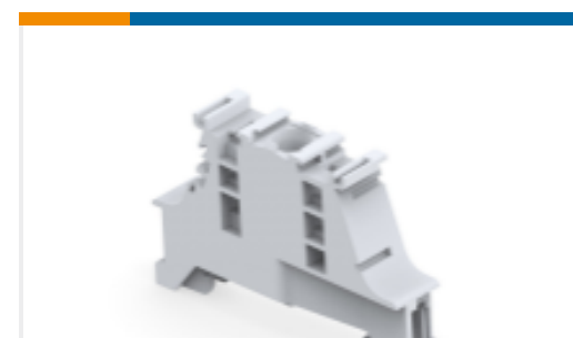
TE 产品编号1SNK900001R0000 BAM4