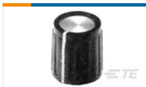
TE 产品编号6-1437624-0 PKG50B1/4=KNOB PLASTIC 1/4 LEX