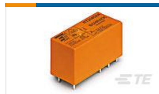
TE 产品编号1393240-7 RT314730