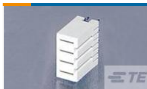
TE 产品编号1903978-1 POWER MODULE 4POS. REC. ASSY,