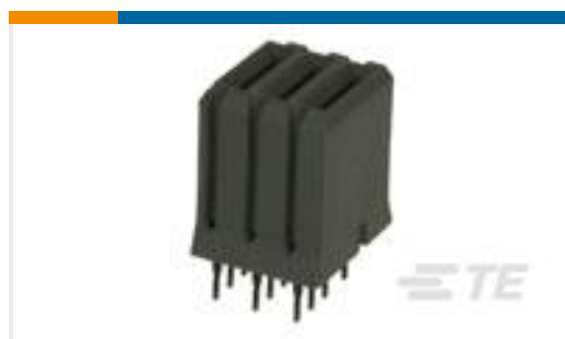
TE 产品编号5-5223955-2 TE UPM Ver Rec 3P HC Power Connector