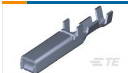
TE 产品编号175194-2 DYNAMIC D-3 REC CONT/S AU 0.38