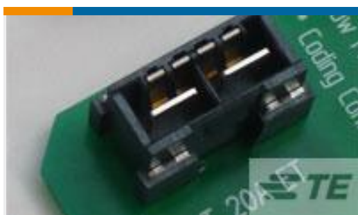
TE 产品编号2042274-2 ELCON MINI 2P VERT HEADER,W/O CODING