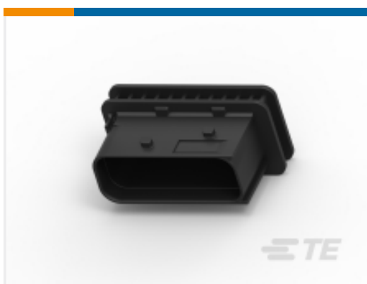
TE 产品编号2112303-1 PROTECTION CAP, FOR REC.HSG GROUP E