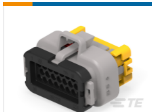
TE 产品编号2371884-4 23POS, AMPSEAL, SOC HSG ASSY, SLD, COD 4