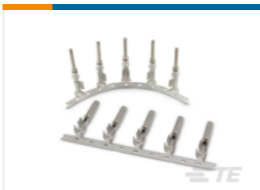
TE 产品编号1924463-1 AMPSEAL 16 端子