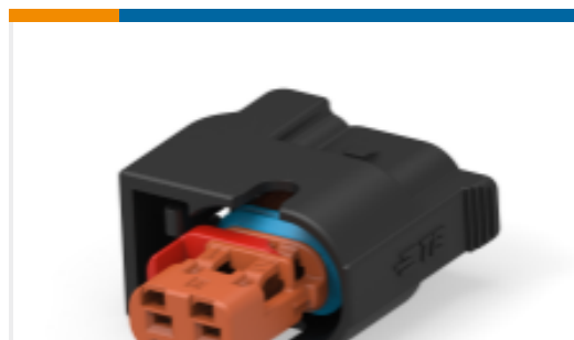
TE 产品编号2098641-4 2POS, MCON 1.2 CB REC 2p SL SEALED