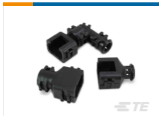
TE 产品编号2292800-3 AMPSEAL 16 连接器尾盖