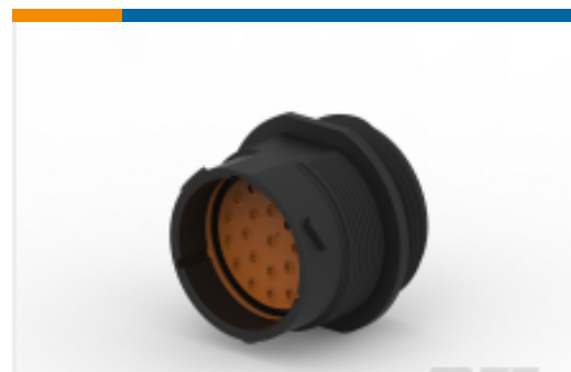
TE 产品编号YHDP24-24-23PEL024 REC, 23P, BLK, E, WTHD, 16, P COD 2