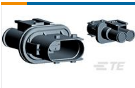
TE 产品编号1394026-1 FLA-STE-GEH9,5MM 2P