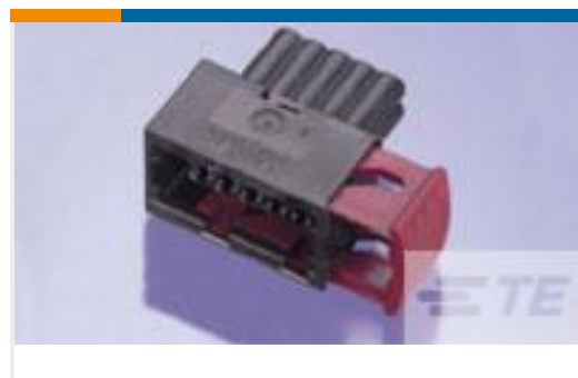
TE 产品编号2-963212-1 6P J-P-T GEH KOMPL