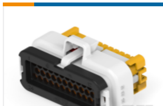
TE 产品编号2371885-2 35POS,AMPSEAL,SOC HSG ASSY,SLD, COD 2