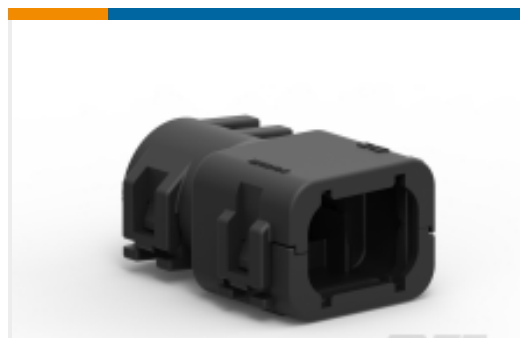
TE 产品编号2292860-3 AS16 BACKSHELL, 2P CAP, NC08, MC