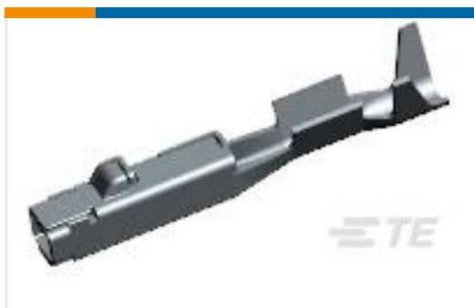
TE 产品编号1534594-3 MCON 1.2 CB REC SRC AG