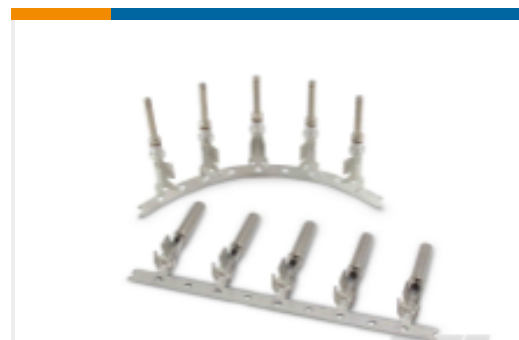
TE 产品编号2098251-2 端子：16号，13A