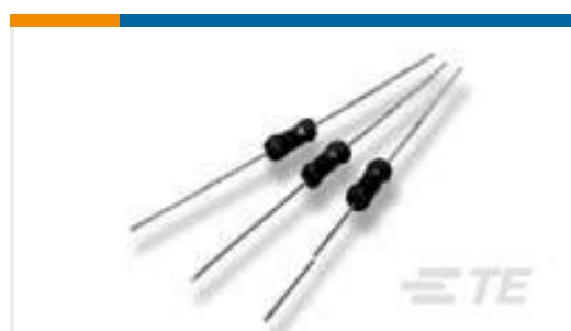
TE 产品编号6-1879354-5 RR03 5% 150R AMMO