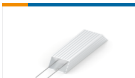
TE 产品编号3-2176503-4 CJP 80W 330R 5% Lead