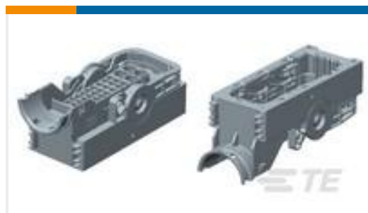
TE 产品编号1-2208685-6 31POS, MIXED,REC HSG,ASSY