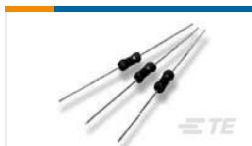
TE 产品编号6-1879354-9 RR03 5% 220R AMMO