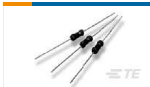
TE 产品编号6-1879354-8 RR03 5% 200R AMMO