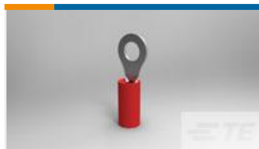
TE 产品编号151730 22-16 PIDG R/T 2BA NYLON EXP.1