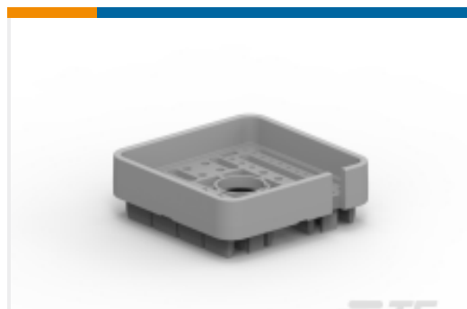
TE 产品编号WB-64SA DEUTSCH DRB Wedgelocks