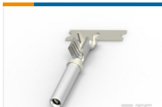
TE 产品编号2098253-2 SOC, SF, SIZE 16, 14-16 AWG, NI/SN