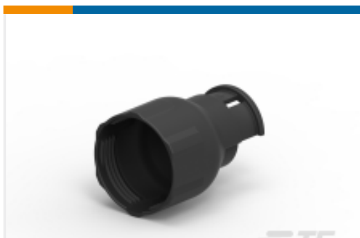
TE 产品编号2428-025-1805 BKSHL, 18SZ, BLK, ST, L024, HDP