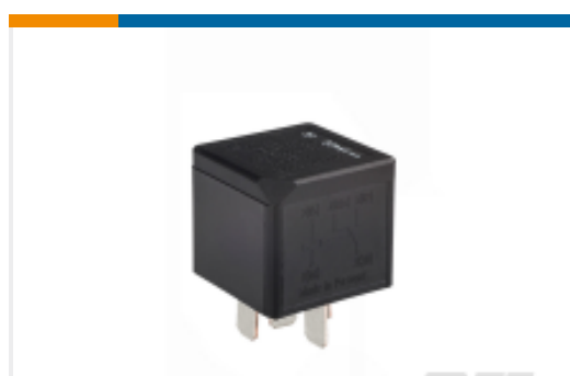
TE 产品编号1-1414687-0 V23136A0004X059-EV-CBOX