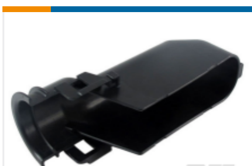
TE 产品编号2138853-1 WIRE EXIT COVER, AMPSEAL 16 HL