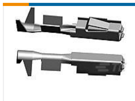
TE 产品编号144969-1 MOS0,63 Sn rec LL unseal. 0,2-0,6