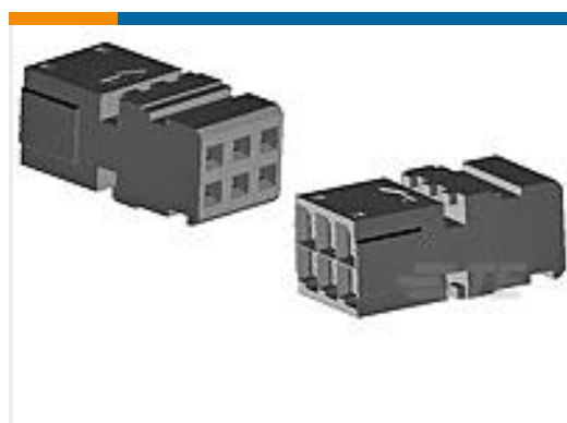
TE 产品编号185311-1 6POS MQS REC