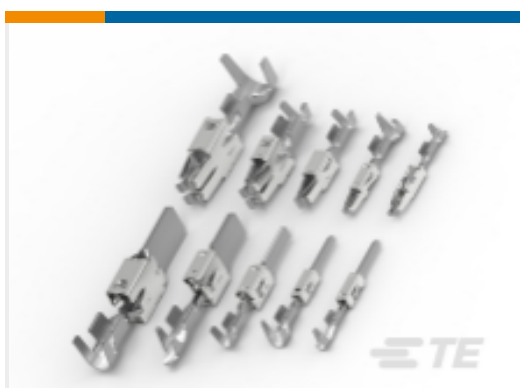
TE 产品编号962936-1 定时器，母端和公端