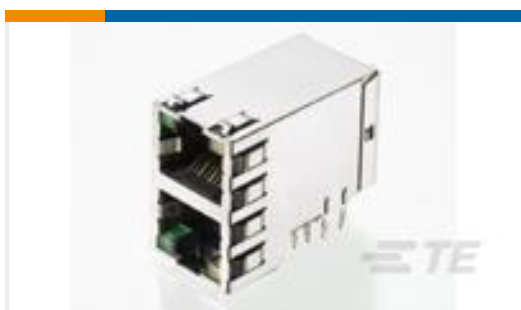
TE 产品编号1888653-5 2X1 OFFSET ST/JK WITH LEDS