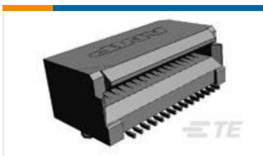
TE 产品编号1367500-1 30 POSN XFP CONN, ENHANCED