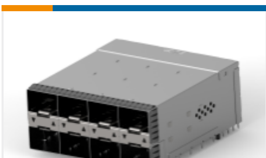
TE 产品编号2340033-6 SFP56 堆叠壳体组件：EMI 弹片