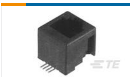
TE 产品编号1-338088-6 8/8 INV.MOD.JACK