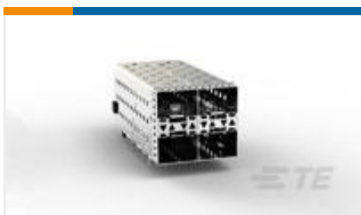
TE 产品编号2007637-5 SFP+ assy 2x2 Spring Fingers 4 LP Sn