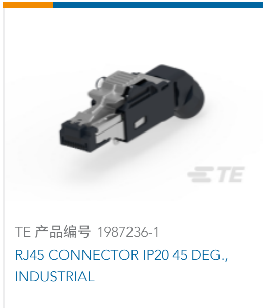
TE 产品编号 1987236-1 RJ45 CONNECTOR IP20 45 DEG., INDUSTRIAL