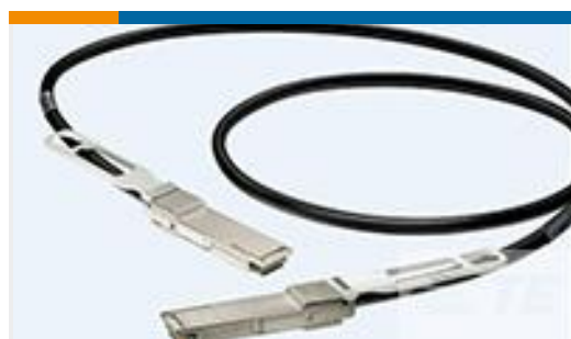
TE 产品编号 2829040-4 QSFP IB EDR, 30AWG, 1.0M