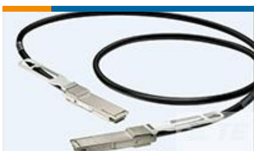
TE 产品编号 2829040-8 QSFP IB EDR, 26AWG, 3.0M