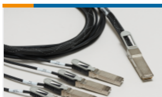
TE 产品编号 2821033-8 QSFP TO [4]SFP+, 28G, 1M, 33AWG