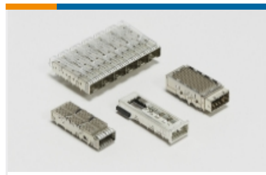
插拔式 IO 连接器和笼子(425)