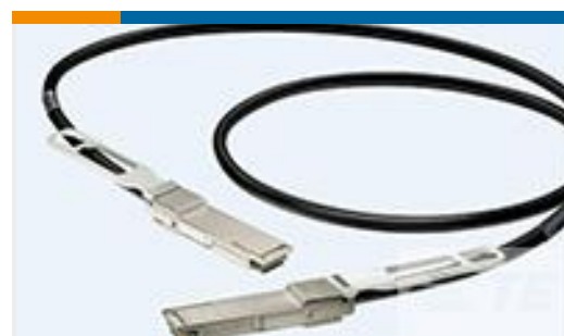
TE 产品编号 2829040-7 QSFP IB EDR, 26AWG, 2.0M