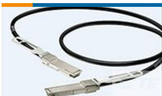
TE 产品编号 2829040-2 QSFP IB EDR, 33AWG, 1.0M