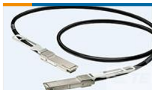
TE 产品编号 2829040-6 QSFP IB EDR, 30AWG, 2.0M