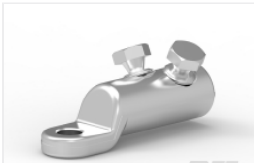
TE 产品编号CAT-BLMT 电压等级高达 84 kV 的力矩螺栓连接器