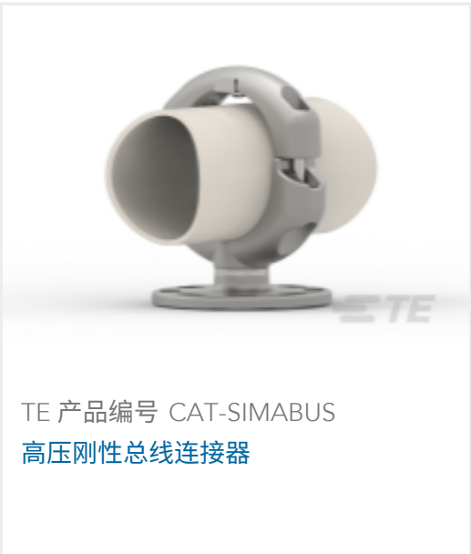
TE 产品编号 CAT-SIMABUS 高压刚性总线连接器