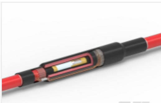
TE 产品编号CAT-MXSU-INL-1C 12-42 kV 热缩电缆接头