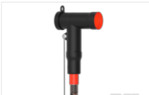
TE 产品编号CAT-RSTI 屏蔽式可分离连接器 1250 A