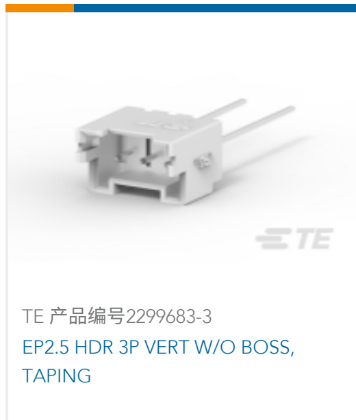
TE 产品编号2299683-3 EP2.5 HDR 3P VERT W/O BOSS, TAPING