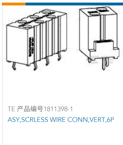
TE 产品编号1811398-1 ASY,SCRLESS WIRE CONN,VERT,6P