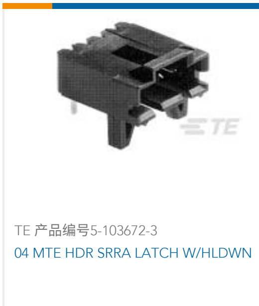
TE 产品编号5-103672-3 04 MTE HDR SRRA LATCH W/HLDWN