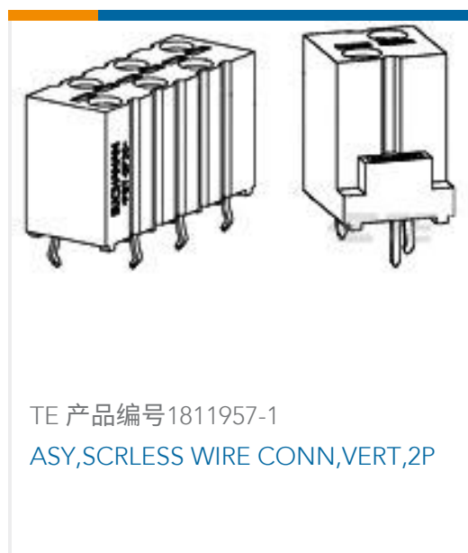
TE 产品编号1811957-1 ASY,SCRLESS WIRE CONN,VERT,2P