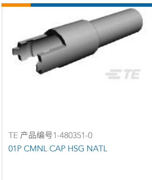
TE 产品编号1-480351-0 01P CMNL CAP HSG NATL