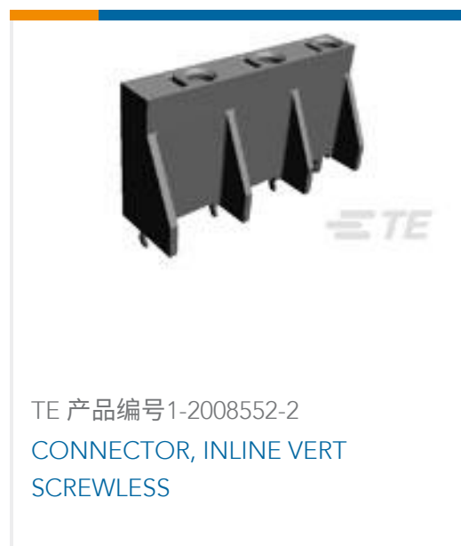
TE 产品编号1-2008552-2 CONNECTOR, INLINE VERT SCREWLESS