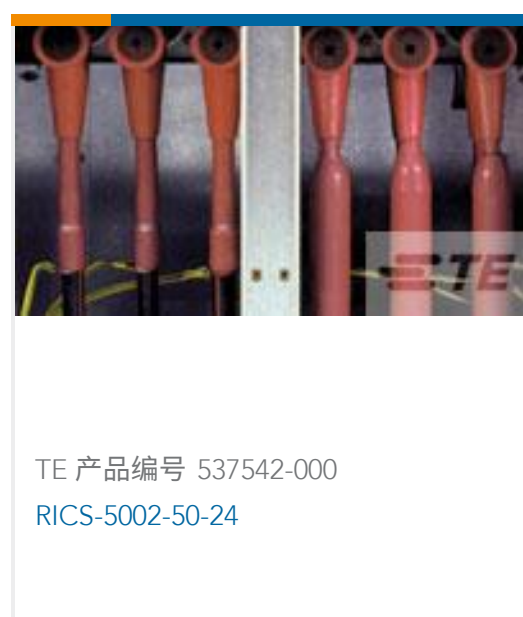
TE 产品编号 537542-000 RICS-5002-50-24