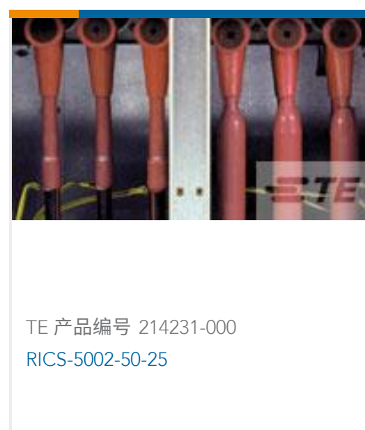
TE 产品编号 214231-000 RICS-5002-50-25