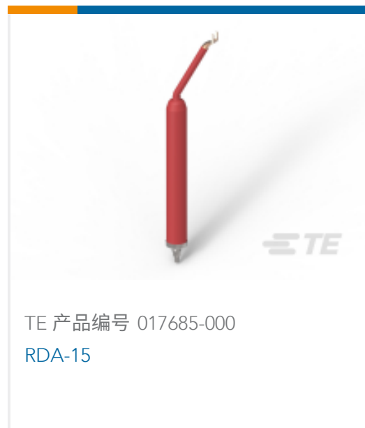
TE 产品编号 017685-000 RDA-15