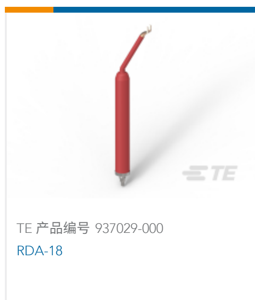
TE 产品编号 937029-000 RDA-18