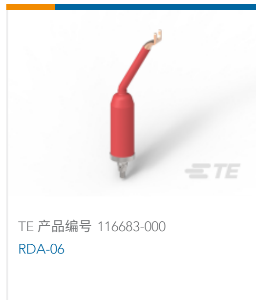
TE 产品编号 116683-000 RDA-06