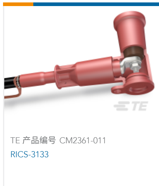
TE 产品编号 CM2361-011 RICS-3133