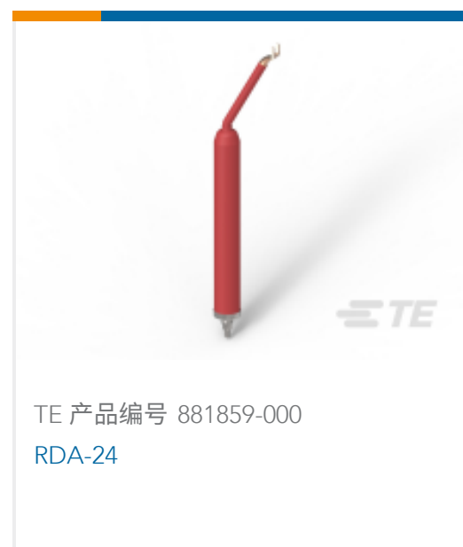
TE 产品编号 881859-000 RDA-24