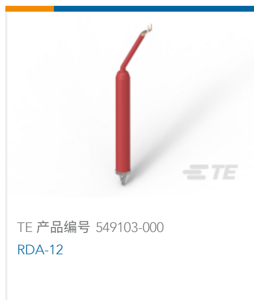
TE 产品编号 549103-000 RDA-12