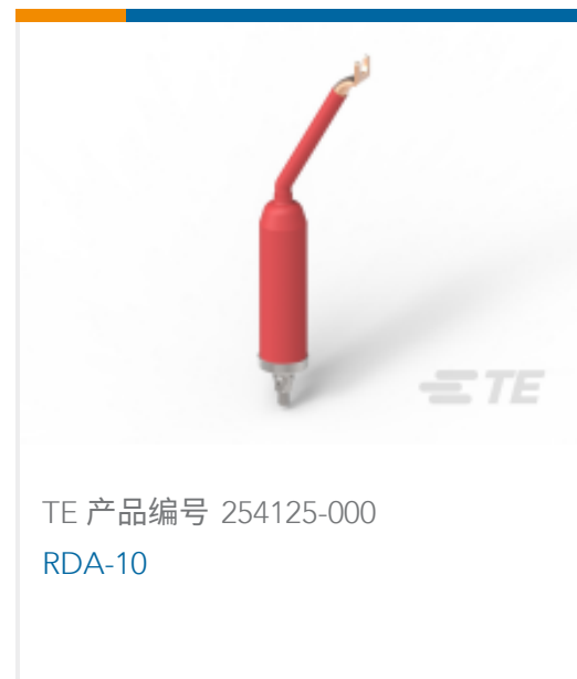
TE 产品编号 254125-000 RDA-10