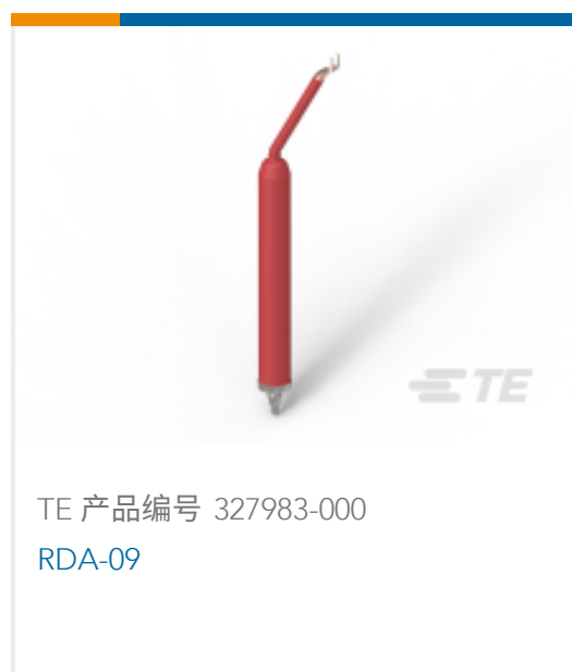
TE 产品编号 327983-000 RDA-09