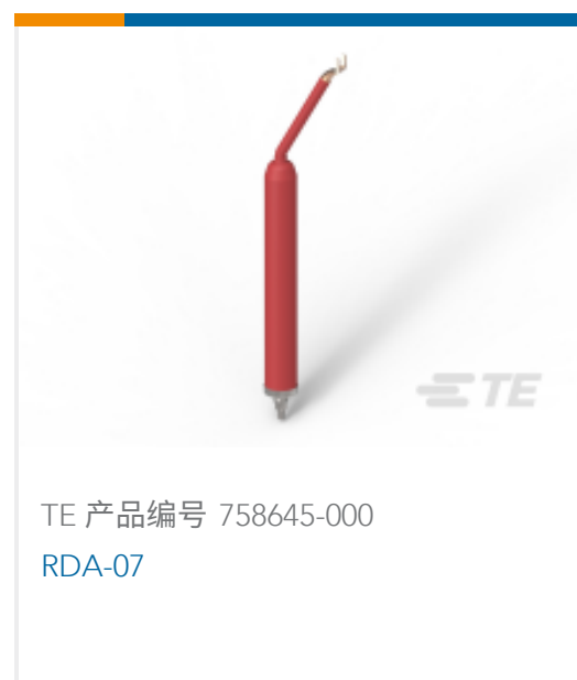
TE 产品编号 758645-000 RDA-07