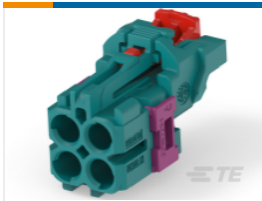
TE 产品编号2-2343139-9 4P,MATE-AX,SOC HSG,UNSLD, 90DEG,COD Z