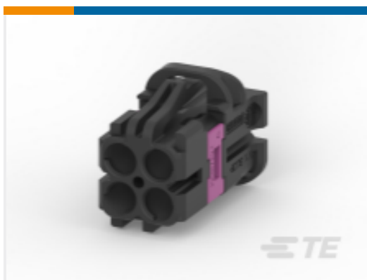
TE 产品编号2298721-1 4P,MATE-AX,SOC HSG ASSY,180DEG, COD A