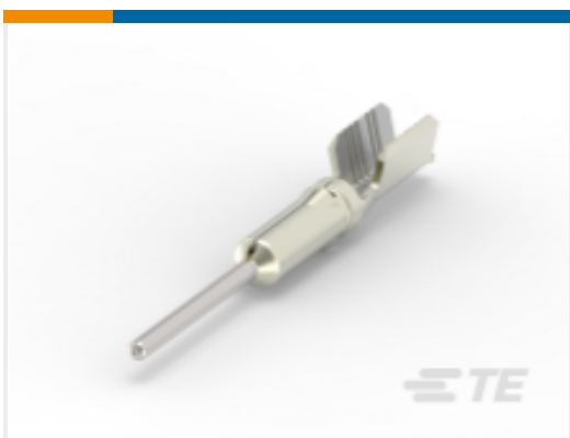
TE 产品编号2298508-1 MATE-AX, Pin center contact, RG 174