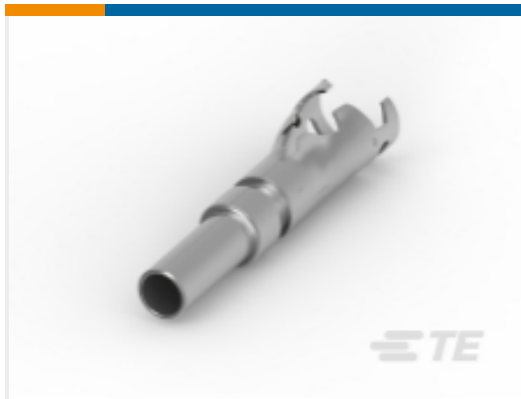
TE 产品编号2298123-1 MATE-AX, Pin outer contact, RTK 031