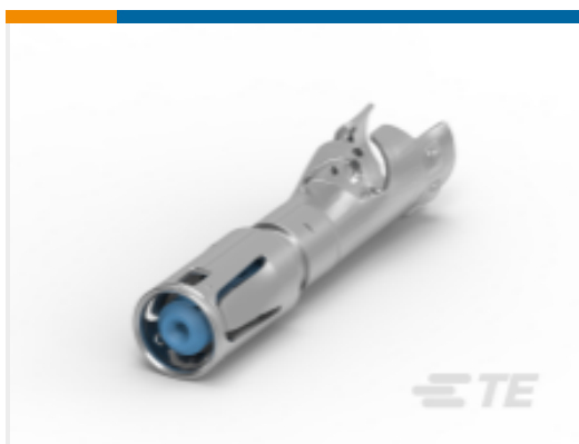
TE 产品编号2298494-1 MATE-AX, Socket outer contact, RG 174