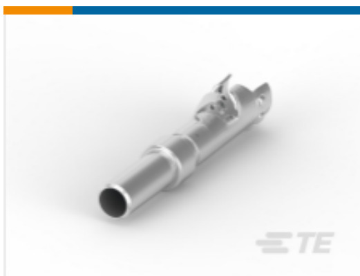
TE 产品编号2298506-1 MATE-AX, Pin outer contact, RG 174