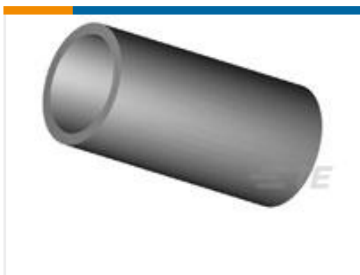
TE 产品编号1488167-1 FERRULE, RTK031, 180 GRAD