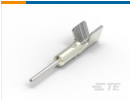
TE 产品编号2298125-1 MATE-AX, Pin center contact, RTK 031