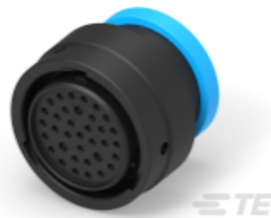
TE 产品编号2289831-1 HDP26-24-35SE-L017, PLG, 35P, E, THD, S