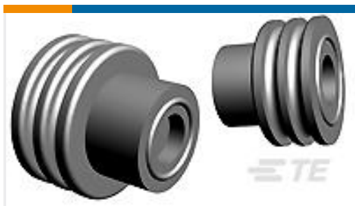
TE 产品编号1719043-1 SINGLE WIRE SEAL, GREEN