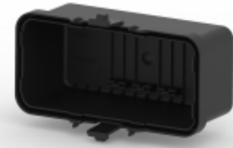
TE 产品编号2098164-1 Cover, 60 Position PDM