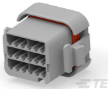
TE 产品编号DTV06-18SA-C015 PLG, 18P, GRY, E, A