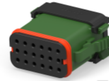
TE 产品编号DT16-18SC-EK02 PLG, 18P, GRN, E, A