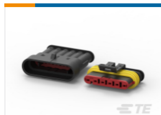
TE 产品编号282104-1 AMP SUPERSEAL 1.5MM, 连接器壳体