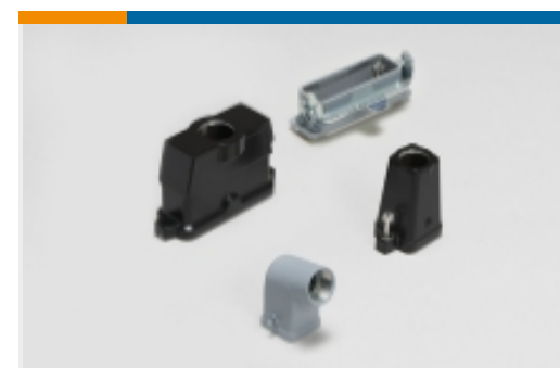
矩形连接器护罩和底座(4)