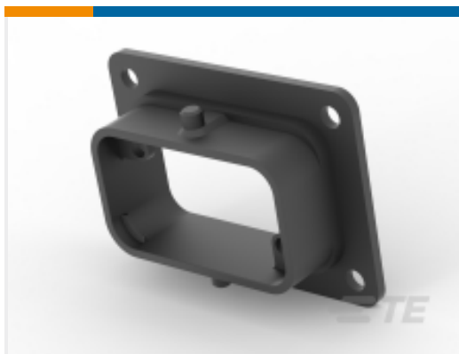
TE 产品编号 2295892-1 SHROUD PLASTIC