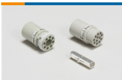
圆形连接器接触件插入件(2)