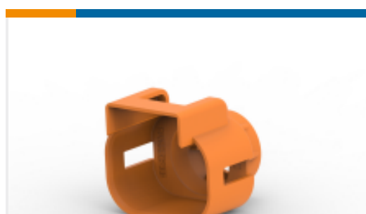
TE 产品编号2103013-3 CABLE SEAL RETAINER, SIZE 2, OR, HVA280