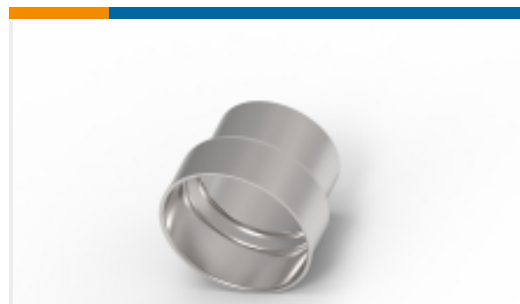
TE 产品编号2177090-3 STEEL, OUTER FERRULE, 8MM HV, 25SQMM