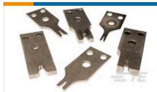
TE 产品编号1-1633961-2 CRIMPER, INSULATION F PREMIUM