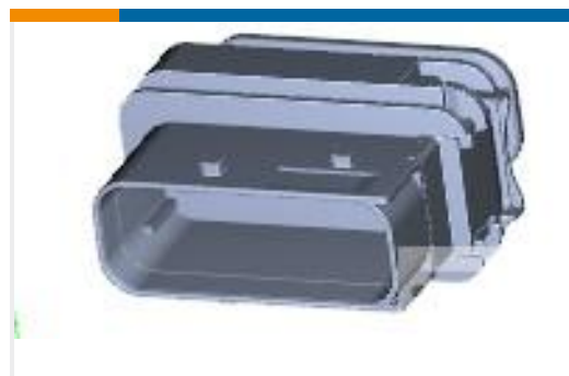
TE 产品编号1-1564534-1 4POS, TAB 5.8X0.8, TAB HSG, ASSY