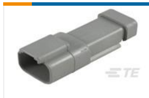
TE 产品编号DT04-2P-CE01 REC, 2P, GRY, E, CAP