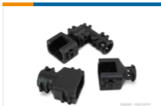
TE 产品编号1-2035366-0 AMPSEAL 16 连接器尾盖