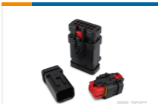
TE 产品编号2040594-4 AMPSEAL 16 Housings