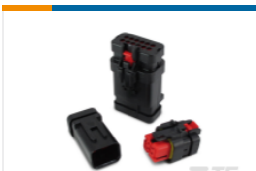
TE 产品编号2040594-5 AMPSEAL 16 Housings