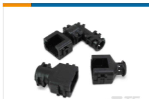
TE 产品编号2292798-3 AMPSEAL 16 连接器尾盖