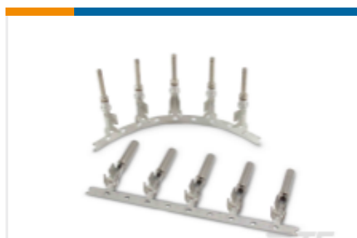
TE 产品编号2098251-1 AMPSEAL 16 端子