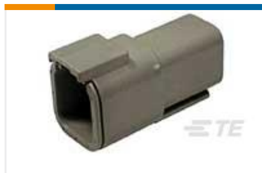
TE 产品编号DTM04-6P REC, 6P, GRY, N