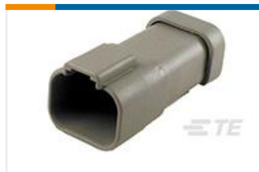
TE 产品编号DT04-4P-CE01 REC, 4P, GRY, E, CAP