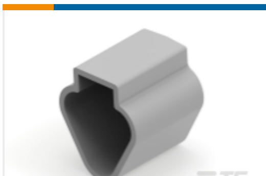
TE 产品编号DT3P-DC PROTECT CVR, 3P, REC, GRY, DT