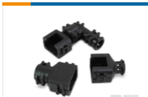
TE 产品编号2292800-1 AMPSEAL 16 连接器尾盖