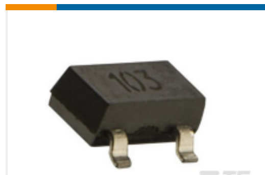
TE 产品编号G-NICO-001 NI 1000 DIN 43760 KLB SOT23