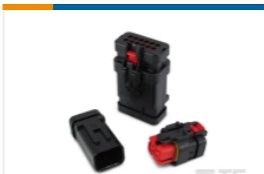
TE 产品编号776428-3 AMPSEAL 16 Housings