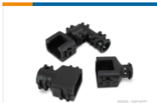
TE 产品编号2292799-1 AMPSEAL 16 连接器尾盖