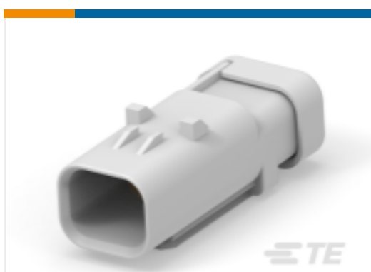
TE 产品编号2320913-1 2POS, AMPSEAL 16, PIN HSG ASSY, SLD, COD 1