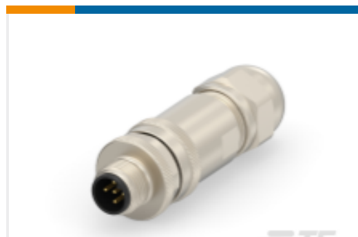
TE 产品编号T4111012051-000 M12 M, 5P GOLD A_CODE S SHIELDED PG9