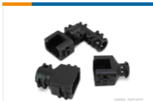
TE 产品编号2292861-3 AMPSEAL 16 连接器尾盖