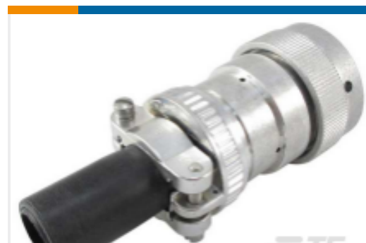
TE 产品编号HD36-24-16PN-059 PLG,16P,AL,N, CBL CLMP BT, DRAIN, 12,P,MC