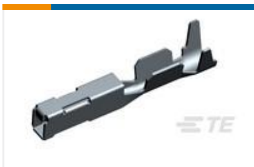
TE 产品编号2035334-4 Contact,female0.64, 18 AWG