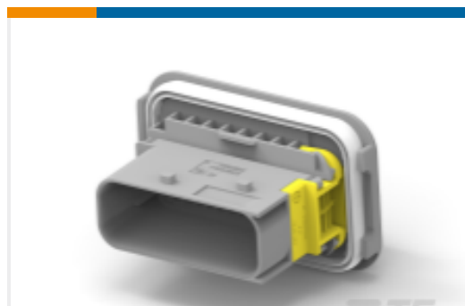
TE 产品编号2-1564536-1 4POS,TAB5.8X0.8,TABHSG,ASSY, COD. B