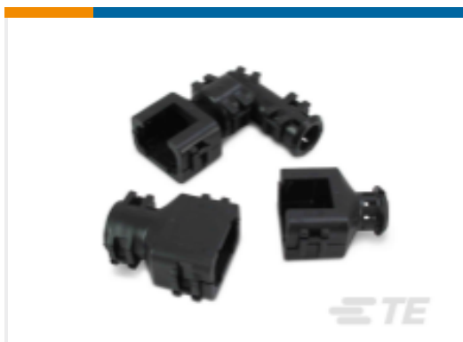
TE 产品编号2292800-3 AMPSEAL 16 连接器尾盖