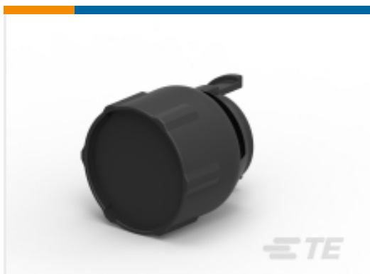
TE 产品编号Y2428-024-24050000 BKSHL, 24SZ, BLK, ST, L024, HDP