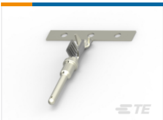
TE 产品编号2098250-3 PIN, SF, SIZE 16, 16-18 AWG, NI/SN