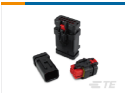
TE 产品编号776532-2 AMPSEAL 16 Housings