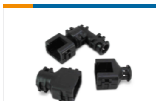
TE 产品编号2292799-2 AMPSEAL 16 连接器尾盖