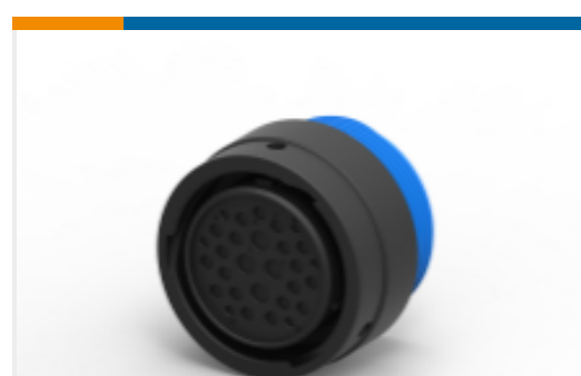
TE 产品编号YHDP26-24-29SEL024 PLG, 29P, BLK, E, WTHD, 12/16/20, S