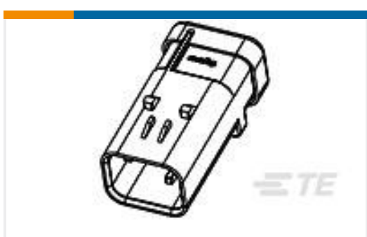
TE 产品编号776536-3 AS 16, 4P CAP ASSY, RD, KEY 3