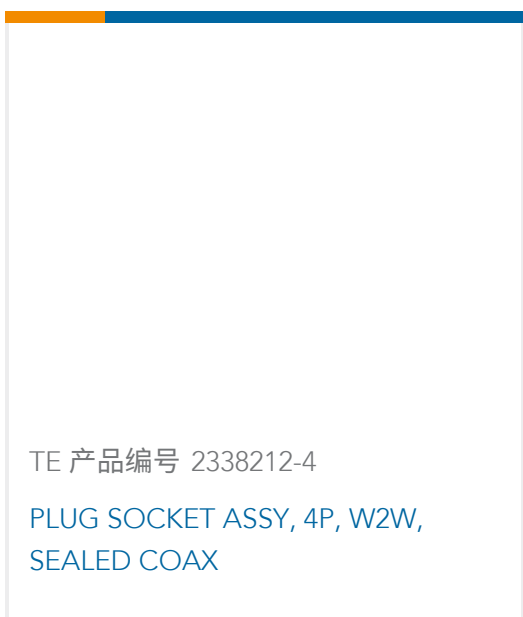
TE 产品编号 2338212-4 PLUG SOCKET ASSY, 4P, W2W, SEALED COAX