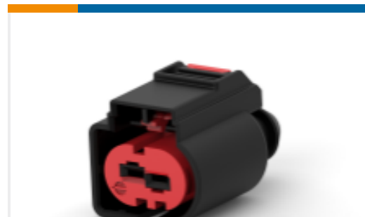
TE 产品编号2-2236706-1 2-POS. SEALED 2.8MM USCAR CLEAN BODY FOR