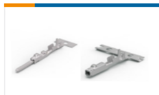
TE 产品编号2141116-3 MCON Receptacle and Tab