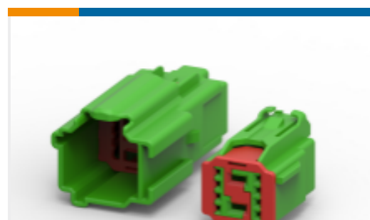
TE 产品编号1-1438153-3 GET .64 连接器系统, 连接器壳体