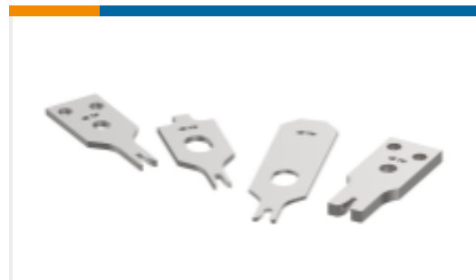
TE 产品编号1803364-3 CRIMPER, WIRE, F PREMIUM NON-TYPICAL RK