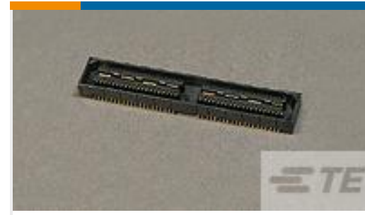
TE 产品编号6-1658043-2 MSB0.80RC-ASY080FL,GP,F,-TR