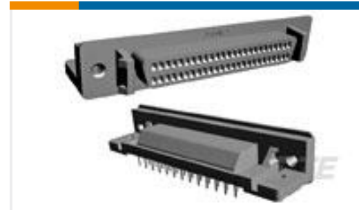
TE 产品编号5787394-5 50 50SR R/A RCPT ASSY, LD FREE