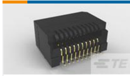
TE 产品编号1888247-2 20 POS SMT CONN, SFP/SFP+, 15A