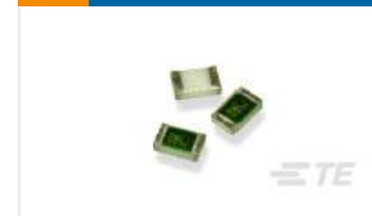
TE 产品编号2-1879208-1 CPF 0402 68R 0.1% 25PPM 1K RL