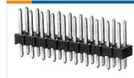
TE 产品编号826632-8 8P AMPMODU II PIN HDR.