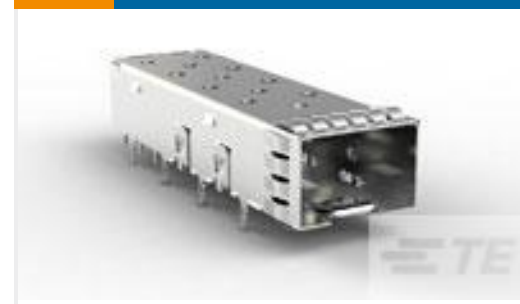
TE 产品编号2007198-1 SFP+ 1x1 Cage Assembly, Press-