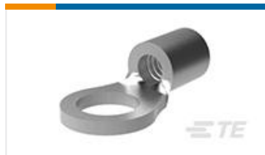
TE 产品编号2-34104-6 SOLIS R 22-16 COMM 22-18 MIL 4