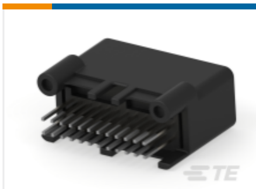
TE 产品编号1376111-6 025 24 POS CAP ASSY V