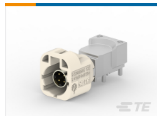
TE 产品编号2286546-2 HSD,HDR ASSY,90DEG,COD B