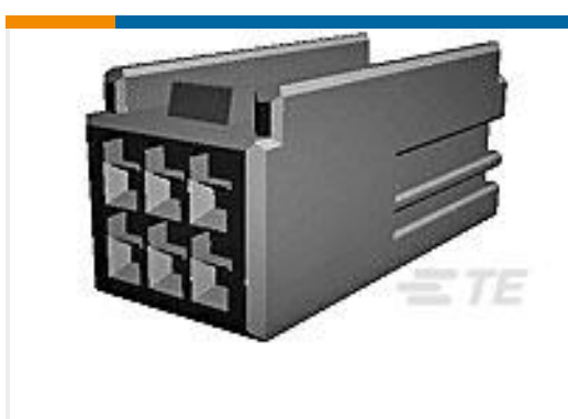
TE 产品编号1747085-1 0.64 6POS PLUG ASSY