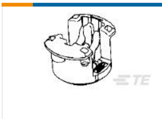
TE 产品编号1473369-3 SQUIB 11DIA SCR ASSY 8.8MM TYP