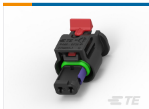
TE 产品编号1-2236896-5 2POS, MCON 1.2 LL REC SEALED