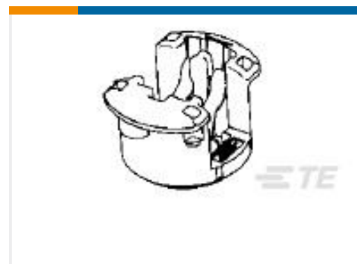
TE 产品编号1473369-7 SQUIB 11DIA SCR ASSY CODE-A GR