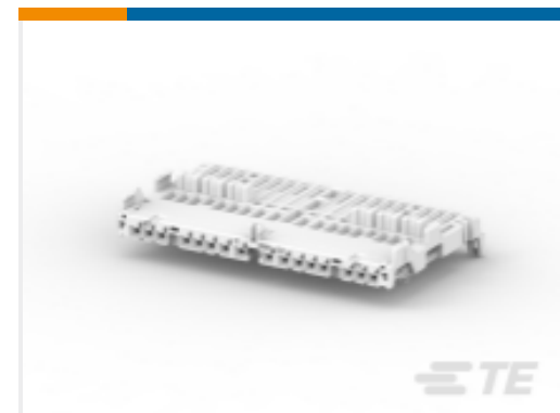
TE 产品编号1903883-1 0.50 SERIES CONN 16POS PLUG HOUSING ASSY