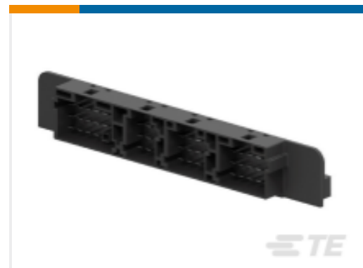
TE 产品编号1-1318384-4 High Pin Count Header