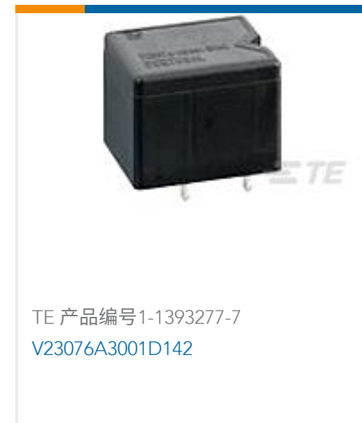
TE 产品编号1-1393277-7 V23076A3001D142