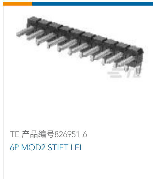
TE 产品编号826951-6 6P MOD2 STIFT LEI