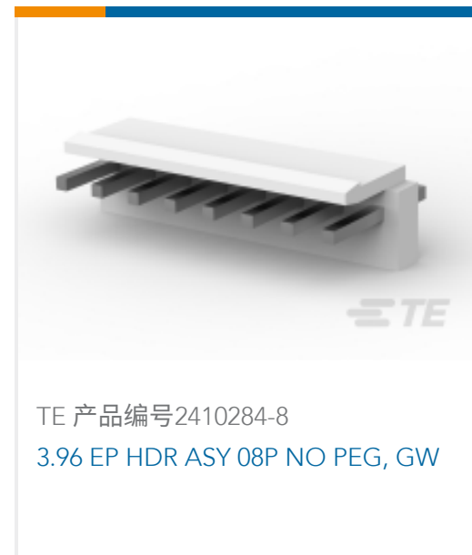
TE 产品编号2410284-8 3.96 EP HDR ASY 08P NO PEG, GW