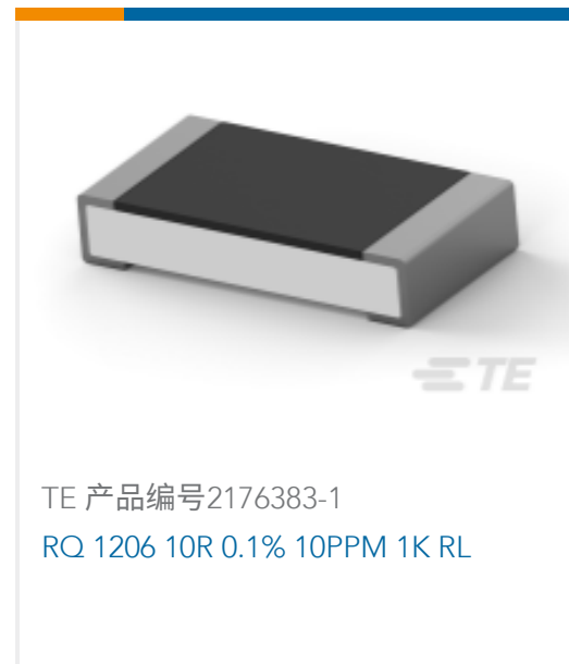
TE 产品编号2176383-1 RQ 1206 10R 0.1% 10PPM 1K RL