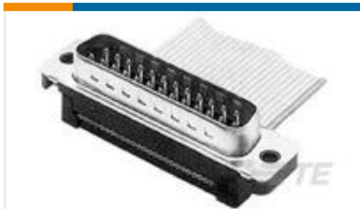
TE 产品编号1658607-1 50 POS HDF PLUG, MS, LEAD FREE