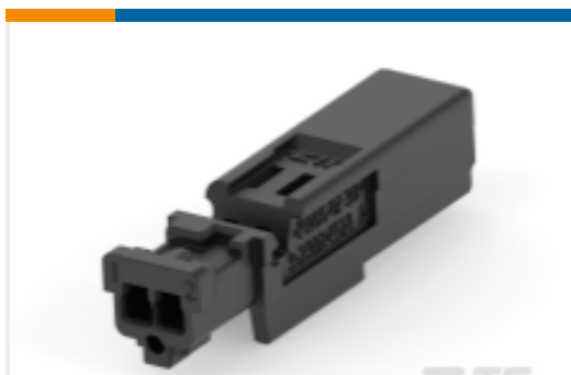
TE 产品编号2302451-1 MATENET, MALE INSERT MODUL