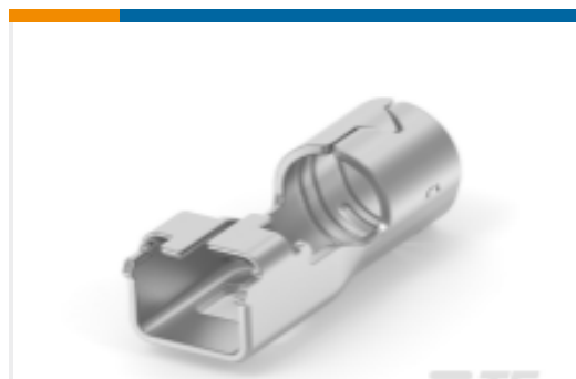
TE 产品编号2302452-3 MATENET, FIXATION ELEMENT