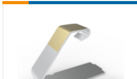
TE 产品编号440423-1 Shield Finger 5025