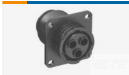
TE 产品编号788189-2 CPC 17-3 RCPT ASY, REV SEX