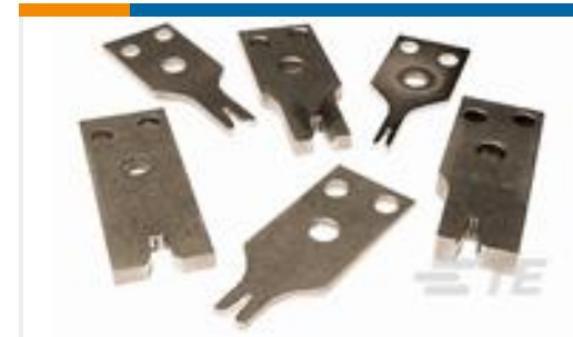
TE 产品编号1-1633961-2 CRIMPER, INSULATION F PREMIUM