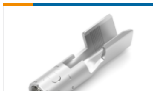
TE 产品编号2208669-3 8MM HV, CONTACT, ASSY