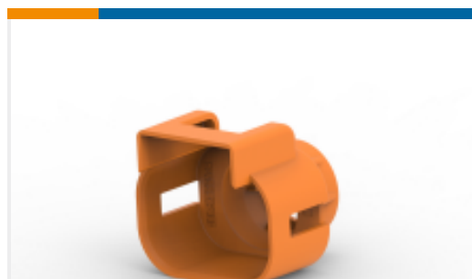
TE 产品编号2103013-3 CABLE SEAL RETAINER, SIZE 2, OR, HVA280