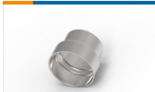
TE 产品编号2177090-3 STEEL, OUTER FERRULE, 8MM HV, 25SQMM