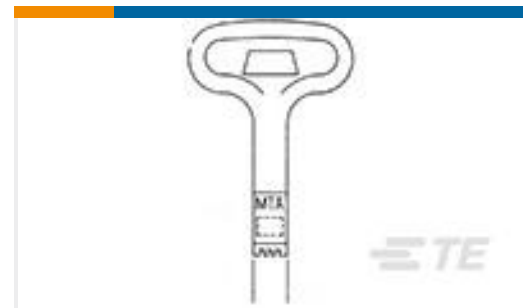
TE 产品编号59803-1 MAINTENANCE TOOL