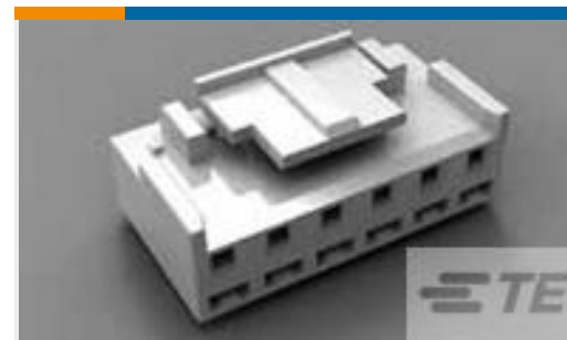
TE 产品编号1-1123722-2 3.96 EP PLUG HSG 2P(NATURAL)