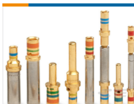
TE 产品编号2803-4-22143 CONT SOC ASSY