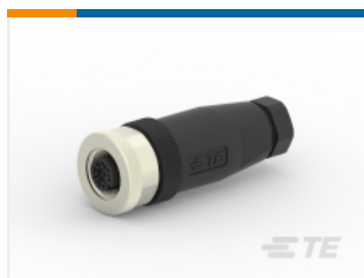
TE 产品编号T4110001081-000 M12,FEMALE,STRAIGHT,A CODE,8P, PG7,GOLD