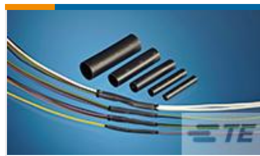
TE 产品编号CH02966001 QSZH-125-NR2-50MM