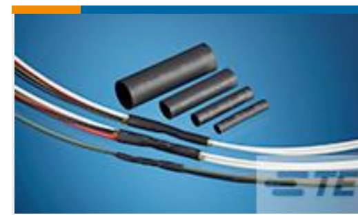
TE 产品编号0989076002 RBK-ILS-125-NR2-0-50MM