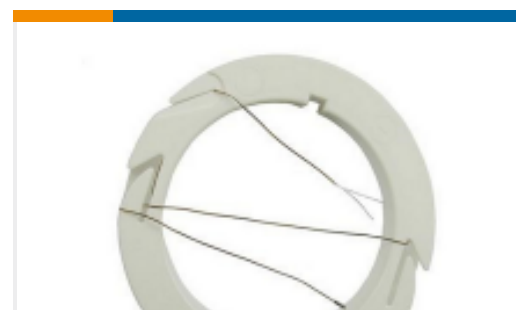
TE 产品编号GAG22K7MCD419 GLS9-MCD +/-15% 37°C 0.38MM