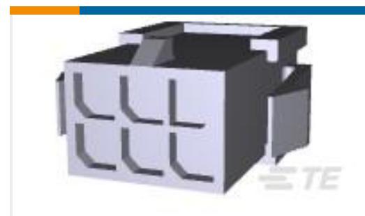
TE 产品编号794615-6 PANEL MT DBL ROW HSG 6 POS