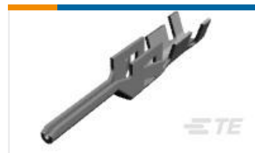
TE 产品编号1-794612-2 PIN CONT 20-24 30 GOLD L/P