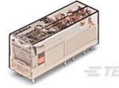
TE 产品编号4-1415053-1 SR4M4024