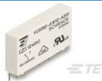
TE 产品编号2-1393236-4 V23092-A1024-A301