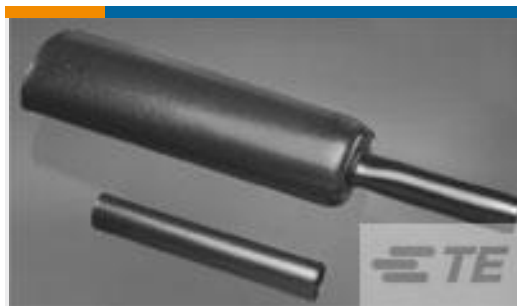
TE 产品编号397892-000 RMW-16/5-1200/ADH-0