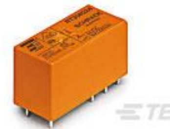
TE 产品编号9-1393239-8 RT314024