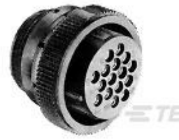
TE 产品编号182649-1 17-14 CPC PLUG RS