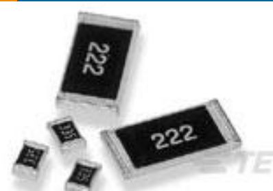
TE 产品编号1622827-1 CRG0603 1% 100K