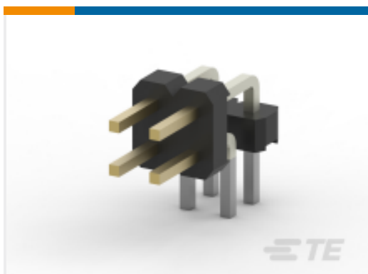
TE 产品编号2271289-1 AMPMODU, PIN HDR, 2.0PITCH, TH, 4PIN