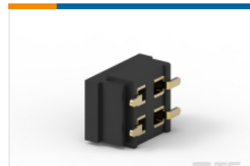
TE 产品编号2271237-4 AMPMODU, REC HDR, 2.0PITCH, SMT, 4PIN