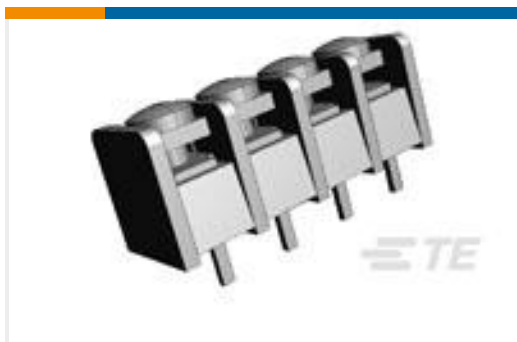
TE 产品编号2-1437667-6 4DB-P108-04=4DB ASSEMBLY