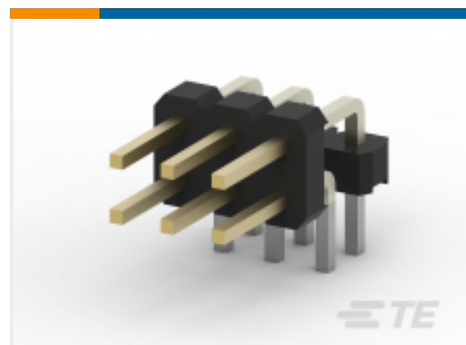
TE 产品编号2271289-2 AMPMODU, PIN HDR, 2.0PITCH, TH, 6PIN