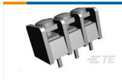
TE 产品编号2-1437667-5 4DB-P108-03=4DB ASSEMBLY