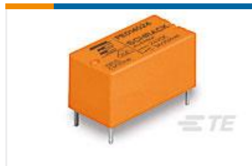
TE 产品编号1-1415390-1 PE014F05