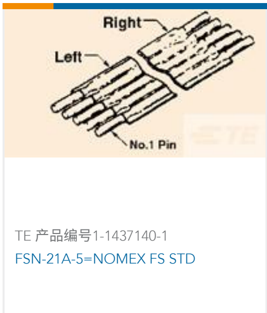
TE 产品编号1-1437140-1 FSN-21A-5=NOMEX FS STD