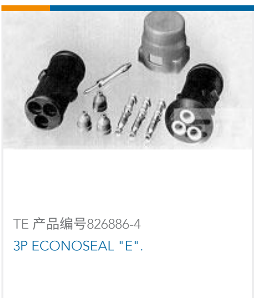
TE 产品编号826886-4 3P ECONOSEAL "E".