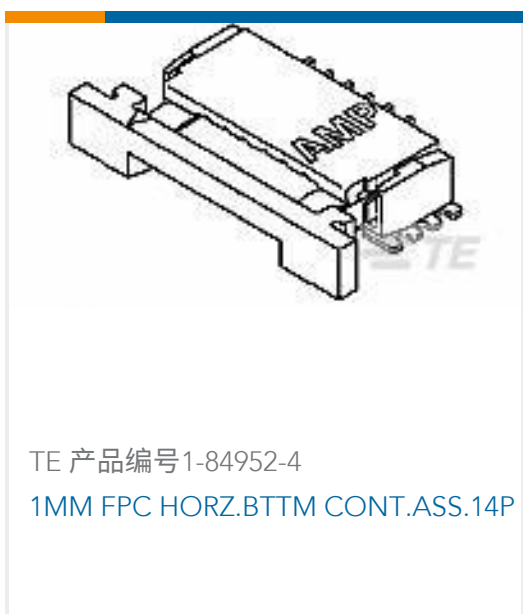
TE 产品编号1-84952-4 1MM FPC HORZ.BTTM CONT.ASS.14P