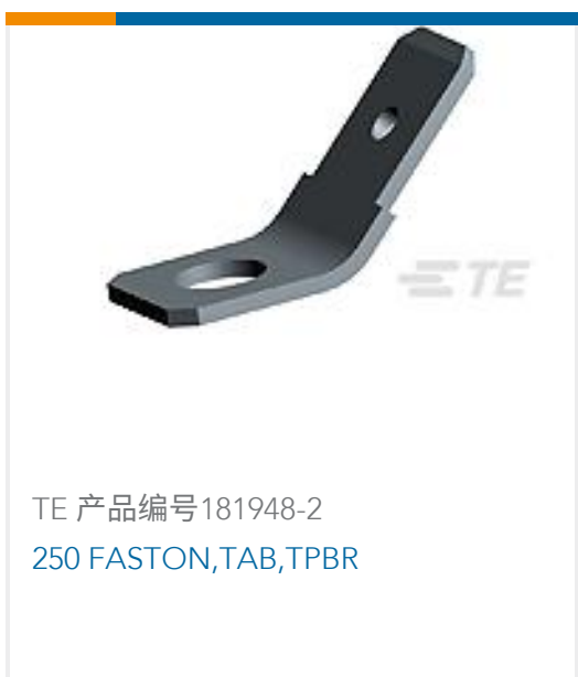
TE 产品编号181948-2 250 FASTON,TAB,TPBR