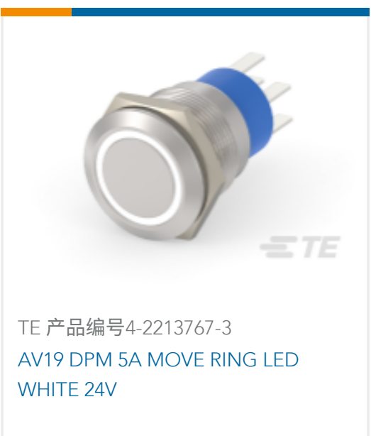
TE 产品编号4-2213767-3 AV19 DPM 5A MOVE RING LED WHITE 24V